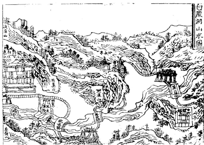
图一：明代嘉靖年间的白鹿洞书院

而从白鹿洞书院自身的环境看，靠北的后屏山，向西的左翼山，朝南的卓尔山，三山环台、山峰汇成环状，俯视似洞。书院北面有环抱的山峦，能够阻挡北风的侵袭，南面有贯道溪常年的流水，稍远处以山为屏，东西侧面仅以小路连接外界，而整个书院的周围森林茂密，草木华滋，至今保有三千多亩原生的林木。如此的环境正合中国风水观念中藏风聚气的“吉地”。正如明代高贲亨撰的，那副嵌于朱子祠前的对子所描述的那样：“列嶂成垣，永护考亭之遗迹；环溪作泮，遥通泗水之真源”。公元1179年朱熹勘察白鹿洞废墟时看到这样的山水形胜，非常感慨：“白鹿洞四面山水，清邃环合，无市井之喧，有泉石之胜，真群居讲学遁迹之所”。对这份得天独厚的自然环境的由衷赞赏，或许是朱熹尽全力复兴白鹿洞书院一个非常重要的原因之一。