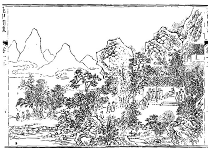
图二：道光十六年张维屏《鹿洞讲书》图

特别是白鹿洞书院的受水的滋养，显出一种清新、灵动与贯通的气象。“贯道溪”经左翼山与卓尔山交会处流出，由西向东，迂回流至白鹿洞前，穿过东面的峡口，注入鄱阳湖中。“贯道溪”不仅取孔子“吾道一以贯之”的寓意，而且也蜿蜒贯穿书院的全境。贯道溪是白鹿洞书院水环境的主体，历代管理者围绕着贯道溪大做文章，建桥、题刻、建亭。