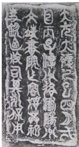
〈爵(A型)内底部铭文拓片〉

藏书设施不是所有书院都有，且各院名称不一，岳麓书院叫尊经阁，主一书院称藏书阁，东山书院叫藏书楼，天门书院虽不知藏书处所的具体称谓，但曾“益市经书”，以供师生研习。凡此皆表明，藏书以助院中教学研究是书院追求的目标。